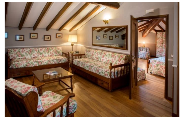
Il salotto della suite