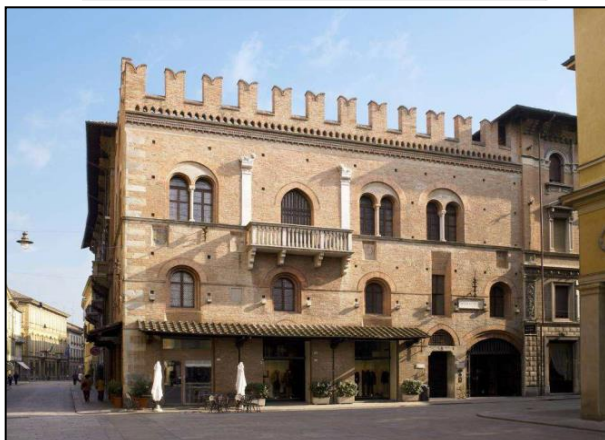
HOTEL POSTA Albergo 4 stelle

500 anni di ospitalità nel centro storico