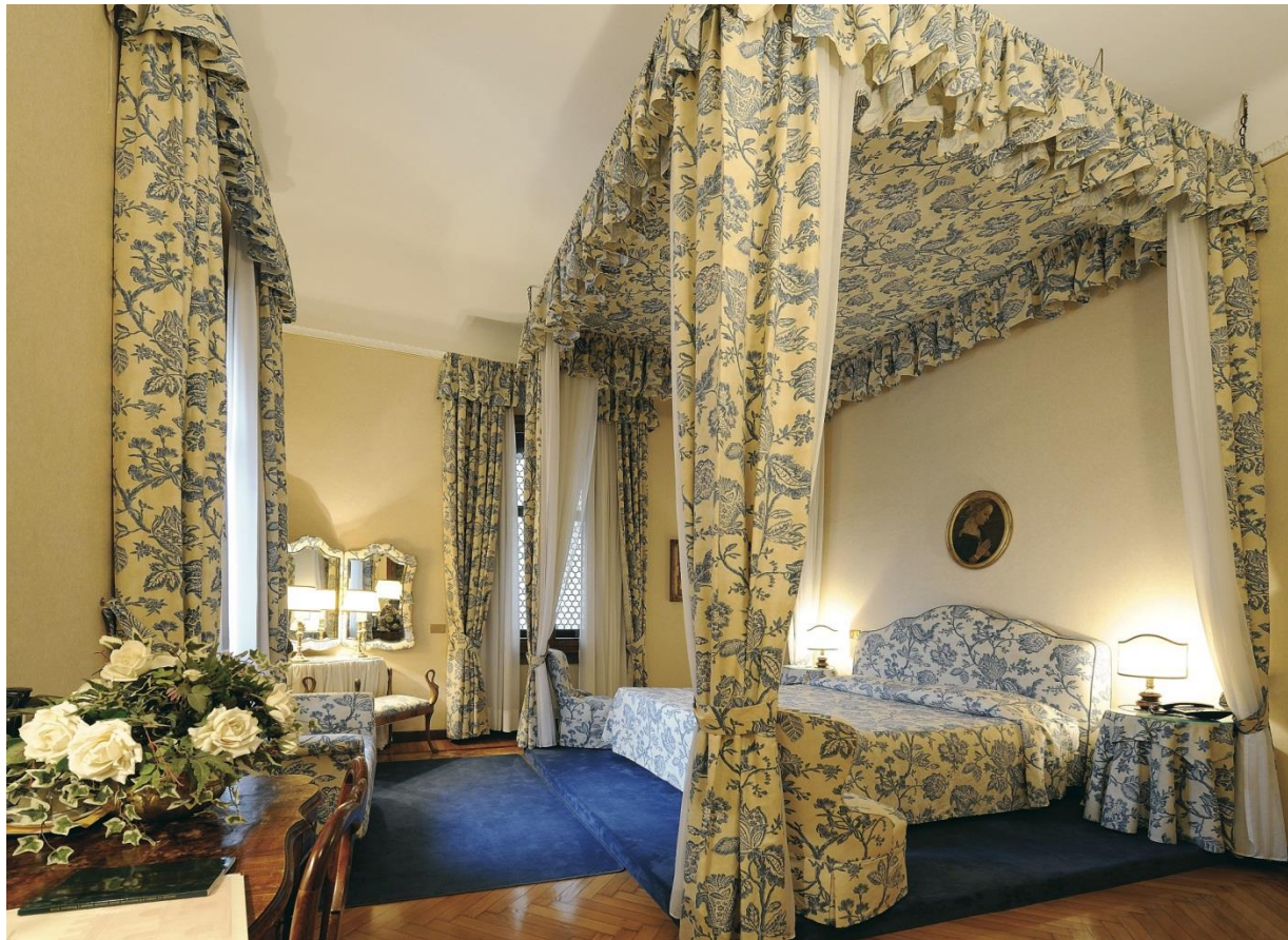
Honeymoon Suite affacciata su Piazza del Monte, letto a baldacchino, due bagni

L'Hotel Posta con le sue 38 camere fra cui 3 suites, 8 junior suites, 3 superior e 24 camere standard, tutte differenti le une dalle altre e tutte arredate con mobili in stile, offre un'accoglienza calda e personalizzata. La Direzione e tutto lo staff sono felici di rendersi disponibili per offrire all'ospite la piacevole sensazione di sentirsi come a casa propria.