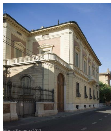
VILLA LEVI TERRACHINI Residenza Privata