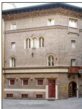
ALBERGO REGGIO Albergo 3 stelle