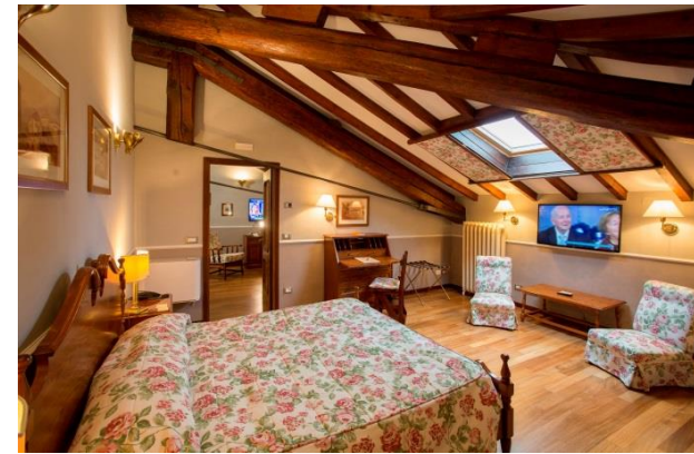
Family Suite in mansarda, ampi spazi, terrazza